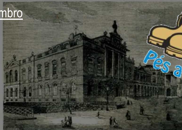
HOSPITAL REAL DE SANTO ANTONIO, NO PORTO